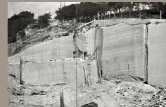
estrazione di pietra Serena da cava propria in Dego (presenti nelle fotografie Ettore e Giancarlo Gilardoni)