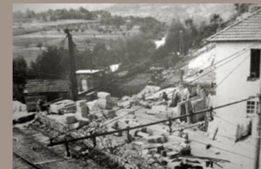
il primo deposito materiali lungo la ferrovia a Dego, 1963