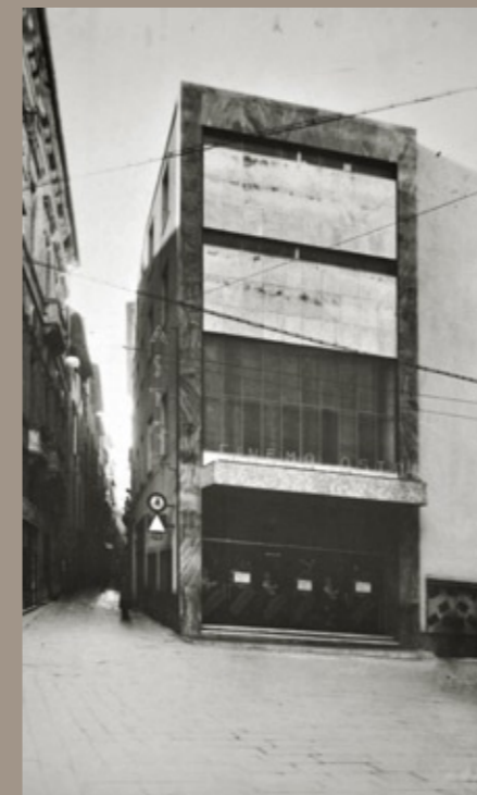
rivestimento esterno del cinema Astor - Savona, 1950 ca.

Un momento di grande impulso si ha nel periodo di ricostruzione post-bellica e lungo gli anni del boom edilizio. Da allora l'azienda ha trovato crescita ed affermazione. Si possono ricordare, tra gli esempi dagli anni '80 ad oggi: il Park Palace di Montecarlo, albergo Al-Alabassy a Baghdad e la sede della Cassa di Risparmio di Savona. Più recentemente, il Palazzo Della Rovere a Savona, l'Ospedale Villa Scassi di Genova, il restauro della chiesa di S. Siro in Sanremo, la Stazione Ferroviaria di Sanremo, la sede ACI di Genova, il Nuovo Mercato dei fiori a Bordighera, il gol S. Anna e Club House di Lerca comune di Cogoleto più residenze e ville padronali di pregio.