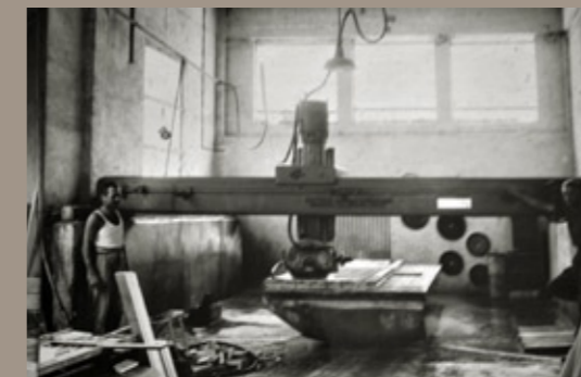
la prima fresa a ponte (modello Africa), metà anni '60