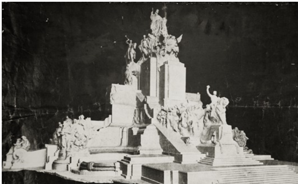
Il bozzetto per il Monumento di Indipendenza del Brasile ideato e realizzato da Ettore Ximenes (scultore) e Manfredo Manfredi (architetto). Carlo Gilardoni partecipò attivamente alla realizzazione dell'opera, inaugurata nel 1922 a Sao Paulo.